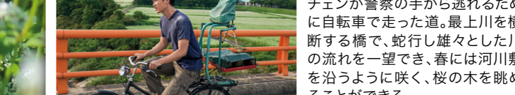
チェンが警察の手から逃れるために自転車で走った道。最上川を横断する橋で、蛇行し雄々とした川の流れを一望でき、春には河川敷を沿うように咲く、桜の木を眺めることができる。