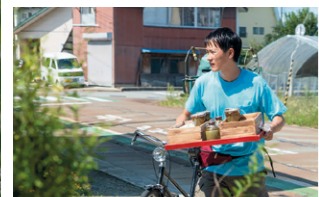
チェンが出前を配達し、町内を自転車で行く場面。