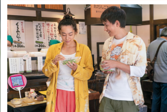
チェンと葉月が初めてデートした場所。店内で流れる『時の流れに身をまかせ』(テレサ・テン)を2人で歌う、印象的なシーンとなっている。彼らが食べていた「ずんだん団子」は、厳選した枝豆を使った店一押しの人気メニュー。