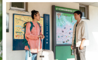
葉月が北京への留学を決意し、電車に乗って旅立つ場面。